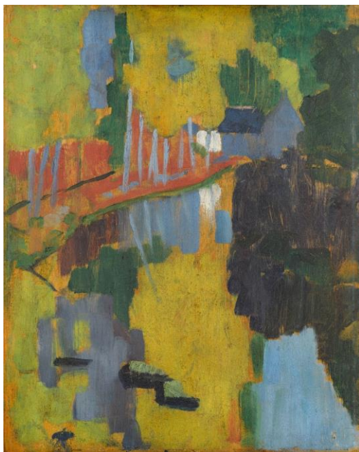
Paul Sérusier (1864-1927), Le Talisman , 1888, peinture à l'huile sur fine planche de bois, 27 cm x 22 cm. Paris, Musée d'Orsay.