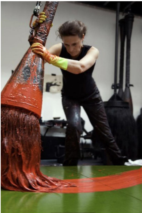
Fabienne Verdier (1962-), Improvisation musicale , image d'atelier 1 .

Document n° 1 : Ressources iconographiques (amplitude ou retenue du geste de l'artiste/instruments, formats et engagements du corps/caractéristiques du support ou des matériaux)