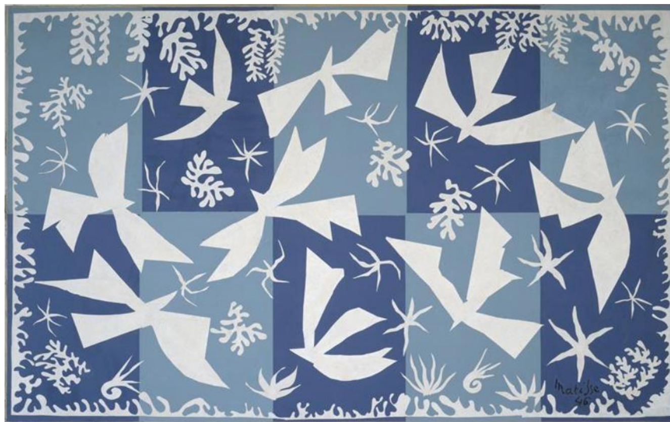
Henri Matisse (1869-1954), Polynésie, le ciel , 1946, papiers collés rehaussés de gouache et marouflés 2 sur toile, 200 x 314 cm. Paris, Musée national d'art moderne, centre G. Pompidou, dépôt du Mobilier national et Manufactures des Gobelins, de Beauvais et de la Savonnerie, 1975.