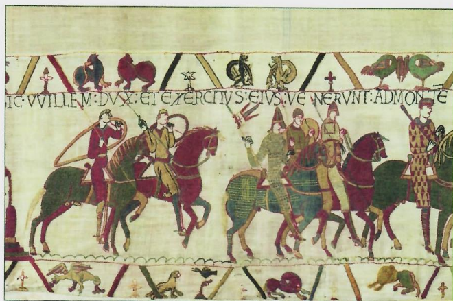
Tapiserie de Bayeux.