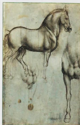
Etude pour la bataille d'Anghiari, De Vinci.