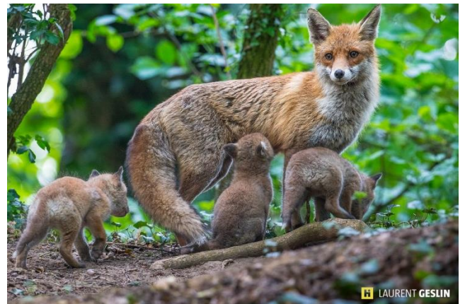
RENARDE ET RENARDEAUX