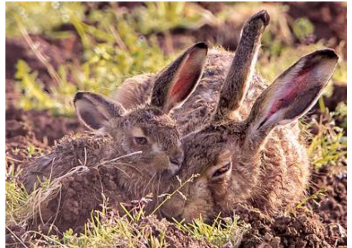
HASE ET LEVRAUTS hase et levrauts