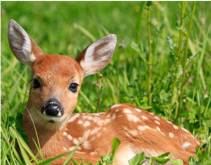
FAON (CERF) faon (cerf)