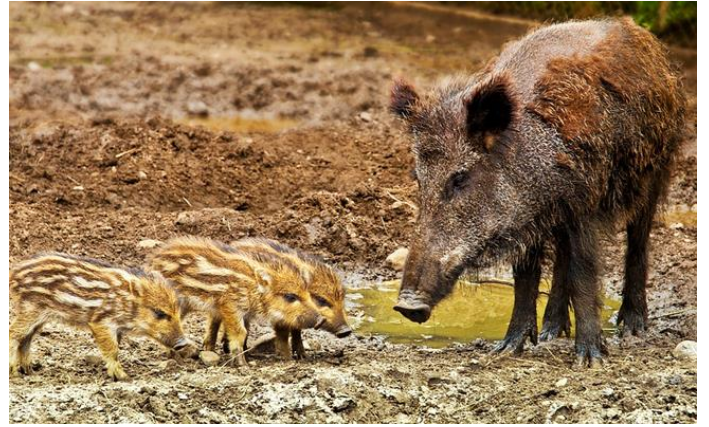
LAIE ET MARCASSINS