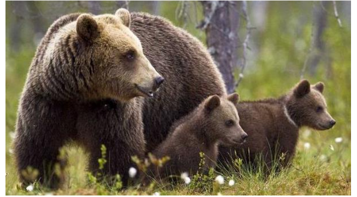
OURSE ET OURSONS